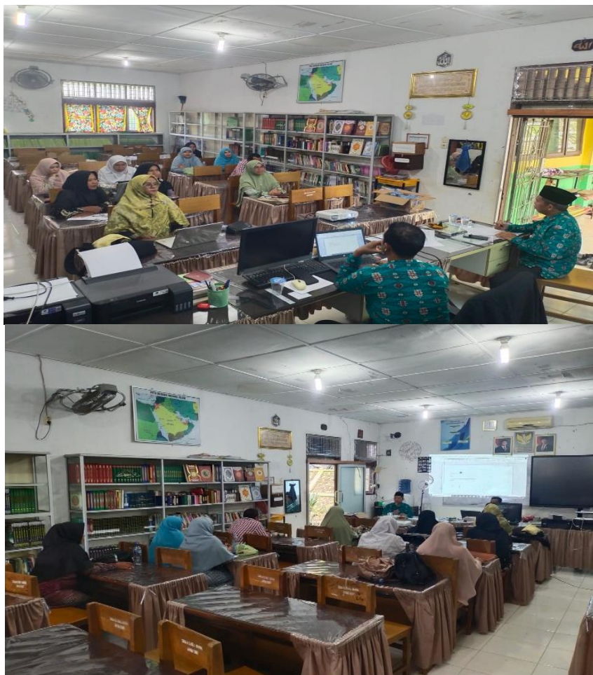
Foto kegiatan MGMP guru PAI SMA Negeri 1 Manyak Payed

kegiatan pengembangan profesional guru. hasil observasi ini didukung juga dengan foto dokumentasi kegiatan MGMP guru PAI SMA Negeri 1 Manyak Payed.