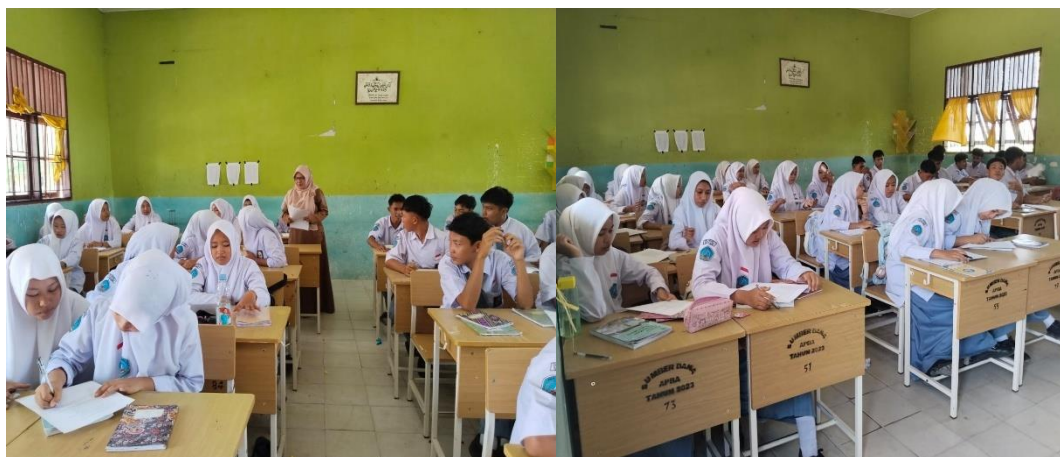
Foto dokumentasi kegiatan Pembelajaran di kelas XI

Secara keseluruhan, dokumentasi peserta didik memperlihatkan bahwa proses pembelajaran PAI di SMA Negeri 1 Manyak Payed berjalan dengan pendekatan yang inklusif, partisipatif, dan berorientasi pada pengembangan potensi setiap siswa. Kolaborasi antara guru, sekolah, dan orang tua menjadi aspek penting dalam menciptakan suasana belajar yang mendukung bagi semua peserta didik.