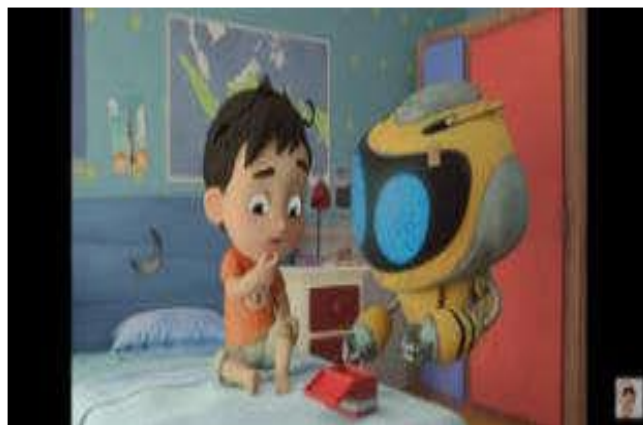
Gambar 4.7 Memaafkan Teman

Dalam adegan 2, Riko menjelaskan kepada Qio kenapa dia bisa terjatuh sampai kakinya terluka. Mendengar cerita Riko, Qio langsung bertanya apakah Arya sudah meminta maaf kepadanya. Namun ternyata Arya belum meminta maaf. Lalu Riko bercerita bahwa dia jatuh karena kedorong Arya saat bermain bola. Namun, Riko telah memaafkan Arya walaupun Arya belum meminta maaf kepadanya, karena riko menilai Arya tidak sengaja mendorongnya. Adegan tersebut terdapat dalam gambar 4.7.