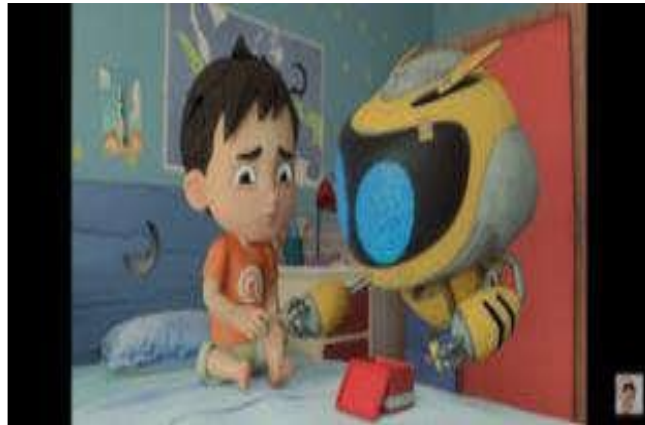
Gambar 4.6 Membantu Teman

bertanya kepada Riko apakah habis terjatuh. Riko memberitahu Qio bahwa dia habis jatuh. Mengetahui hal itu, Qio langsung bergegas mengambilkan obat untuk mengobati kaki Riko yang terluka. Adegan tersebut terdapat pada gambar 4.6.