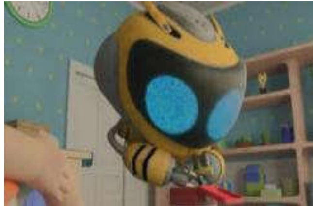
Gambar 4.2 Profil Qio