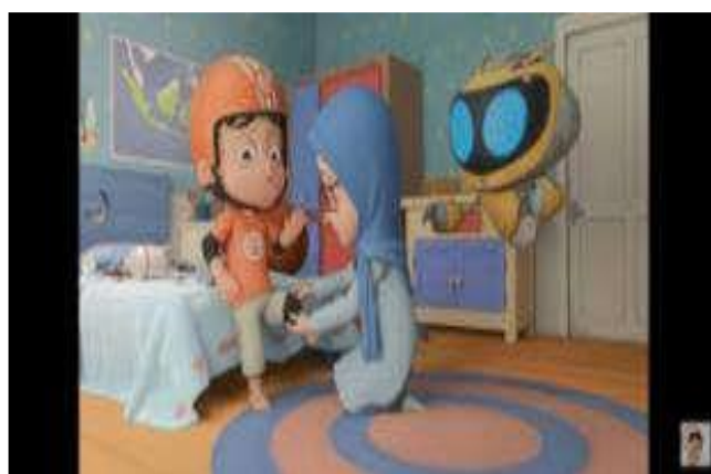
Gambar 4.9 Saling Menyayangi

melakukannya karena dia tahu papa-nya Arya galak. Dalam scene ini adalah perhatian dan kasih sayang seorang kakak kepada adiknya. Dilihat dari kakaknya Riko yang datang ke kamar untuk bertanya kepada Riko apakah Riko baik-baik setelah itu kakaknya langsung mencari bagian mana Riko terluka, ini menunjukkan perhatian dan kasih sayang seorang kakak terhadap adiknya. Adegan tersebut terdapat dalam gambar 4.9.