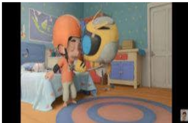
Gambar 4.8 Menolong Teman

Pada adegan 4 riko menemukan body protector nya, kemudian Riko langsung memakainya mulai dari lutut, siku tangan, dan kepala. Namun karena pelindung kepala Riko terlalu ke bawah sampai menutupi mata hingga membuat Riko tidak bisa lihat. Melihat hal itu Qio tanpa pikir panjang langsung menolong Riko untuk menaikan pelindung kepalanya supaya tidak menutupi mata Riko. Adegan tersebut terdapat dalam gambar 4.8.