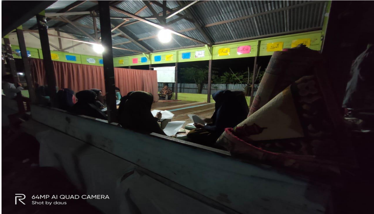
R 64MP AI QUAD CAMERA